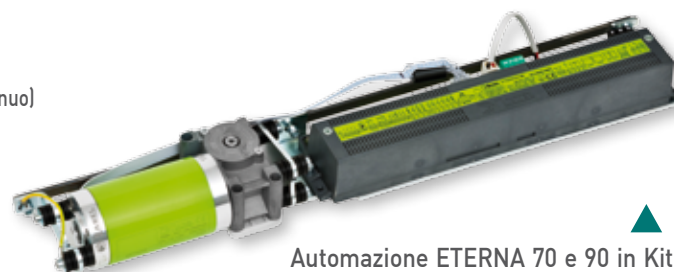
Automazione ETERNA 70 e 90 in Kit

Monoblocco motore e centralina FAST SET assemblati su telaio unico per ridurre a pochi secondi il tempo di montaggio.